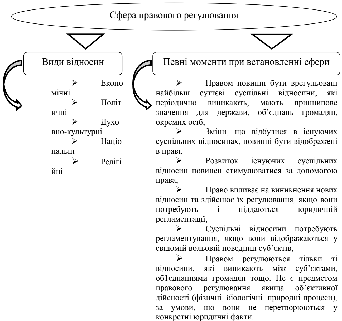
Мал. 2. Сфера правового регулювання

При встановленні сфери правового регулювання слід виходити не стільки із класифікації суспільних відносин (економічних, політичних тощо), скільки із матерії самого права як нормативного регулятора, цілеспрямованість якого – порядок у суспільстві. Є різні класифікації сфер правового регулювання (табл. 3).